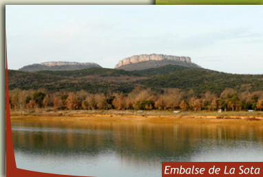
Embalse de La Sota