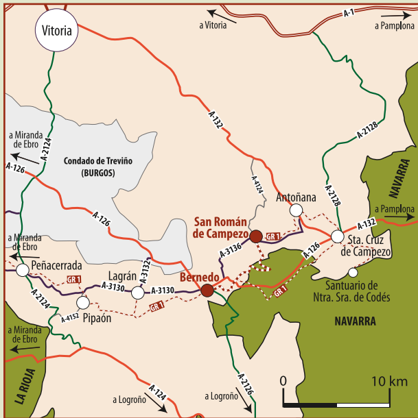
San Román de Campezo