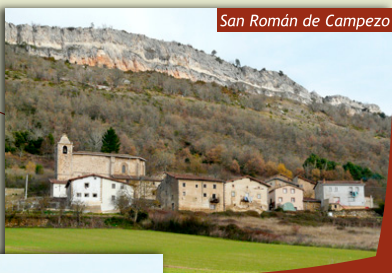
San Román de Campezo